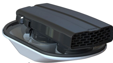
Option module électrique